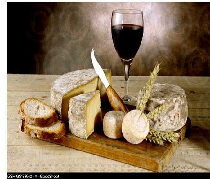
GSH-GS163042 - GoodShoot